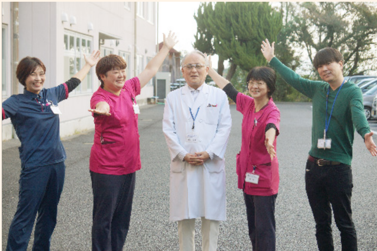
医療法人済家会 島原保養院内に設置されている「認知症初期集中支援チーム」の皆さん（島原市南下川尻町 8192-2）