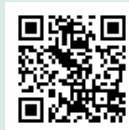
広域圏ホーム ページ

詳しくは、本組合ホームページ(WEB サイト)の「採用情報」をご覧ください。 また、ハローワークでも求人として掲載しています。